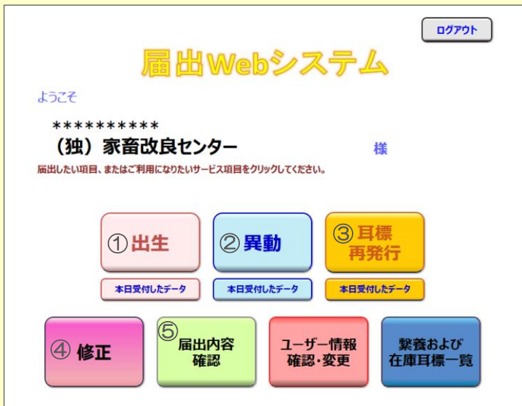
届出Webシステムトップ画面