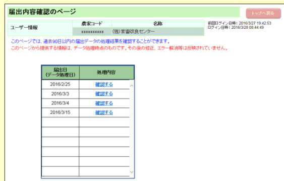
⑤届出内容の確認 (過去90日以内まで可)