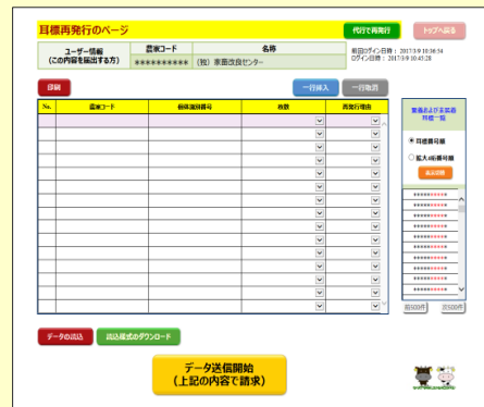
③耳標の再発行請求